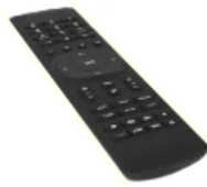
Diaľkové ovládanie 2× AAA batéria