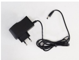
Zdroj, kábel na pripojenie do napájacej siete (230V)